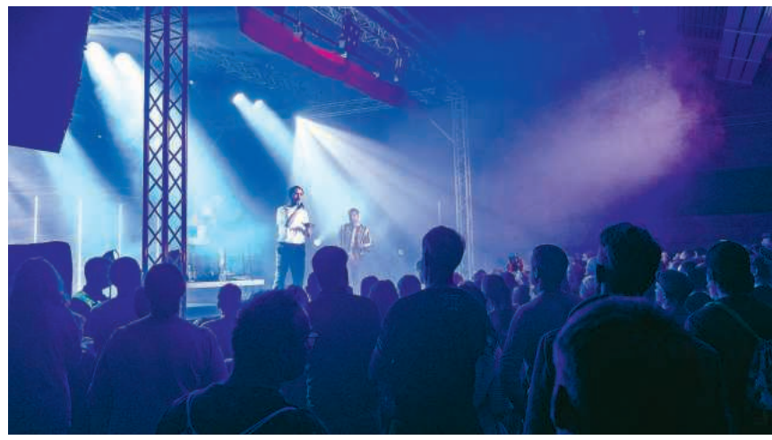
Lo & Leduc begeisterten das Publikum in der Vianco-Arena Brunegg

Neben den musikalischen Highlights gab es auch kulinarische Höhe-