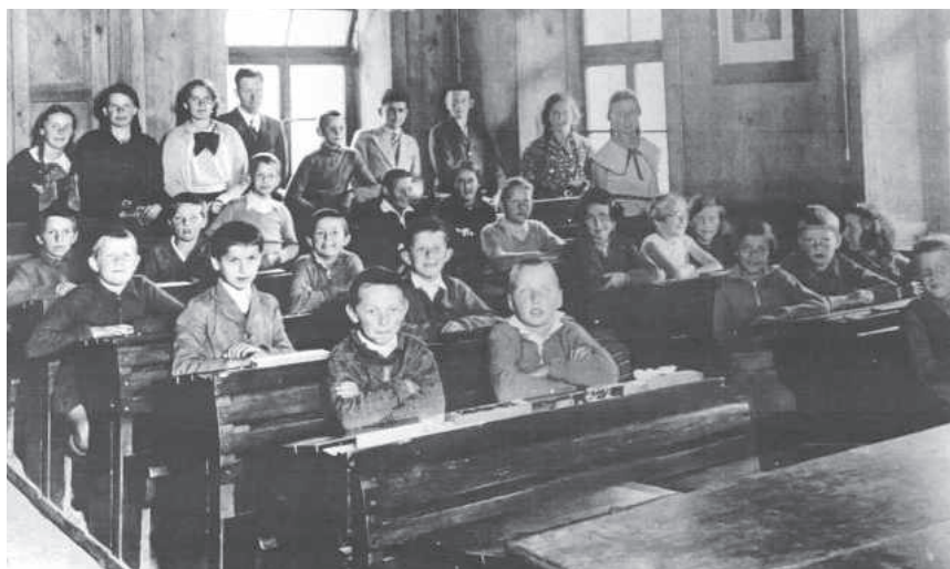
Die Schule Linn im Jahr 1937

Auch ein warmes Klassenzimmer ist heute selbstverständlich. Ganz anders im letzten Jahrhundert. Ein Teil der Ausstellung im Museum Bözberg bildet die Schulstube, in der sich ein