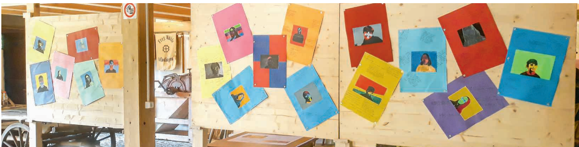
Die Porträts der heutigen Schülerinnen und Schüler der 4./5. und 6. Klassen vom Bözberg sind ebenfalls im Museum zu sehen