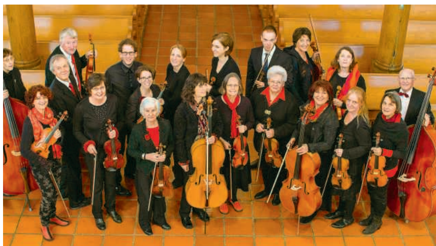
Musiziert nach Herzenslust: Hochtunisches Kammerorchester