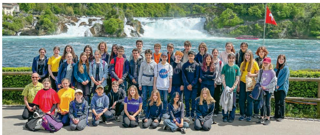
Ausflug nach Schaffhausen: Der Bez-Chor Brugg vor dem grössten Wasserfall Europas – dem Rheinfall