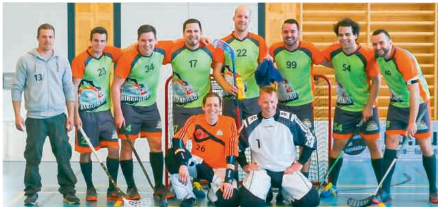
Erfolgreiche Unihockeymannschaft des TV Birrhard