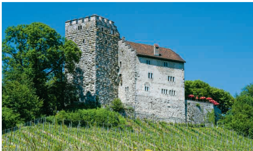
Schloss Habsburg virtuell erleben

Auf dem Schloss Habsburg kann man von 10 bis 17 Uhr «Schloss Habsburg virtuell» erleben. Mit einer Virtual-Reality-Brille lässt sich auf einem 360-Grad-Rundflug die imposante Grösse der Burg erkunden, wie sie anno 1200 auf dem Wülpelsberg thronte. Aus der Vogelperspektive blickt man auf die Burg von damals und ist mittendrin in der Welt der Habsburger des 13. Jahrhunderts.