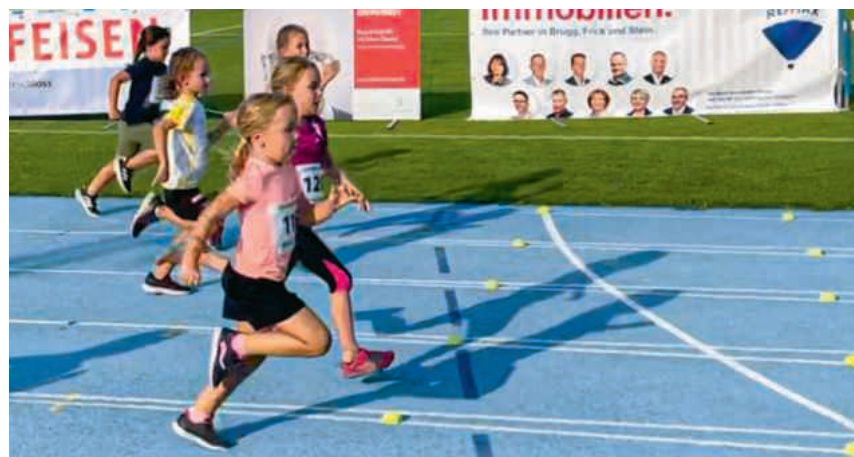
Über 200 Mädchen und Jungs wollen es wieder wissen - wer läuft als Erste oder Erster über die Ziellinie?

Der Visana-Sprint ist ein nationales Nachwuchsprojekt von Swiss Athletics. Es soll Kindern die Freude am Rennen und an der Bewegung vermitteln und dabei helfen, junge Sprinttalente möglichst früh zu erkennen und sie zu fördern. An lokalen Ausscheidungen - also an Rennen wie dem «schnellschte