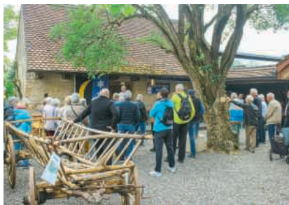
Die Ehrenmitglieder trafen sich