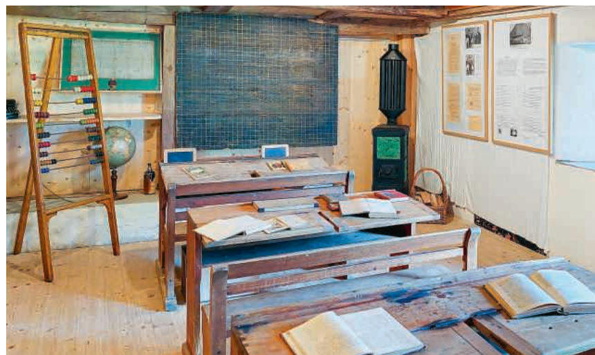
Schulstube im Museum Bözberg mit Tragofen und Holzstapel