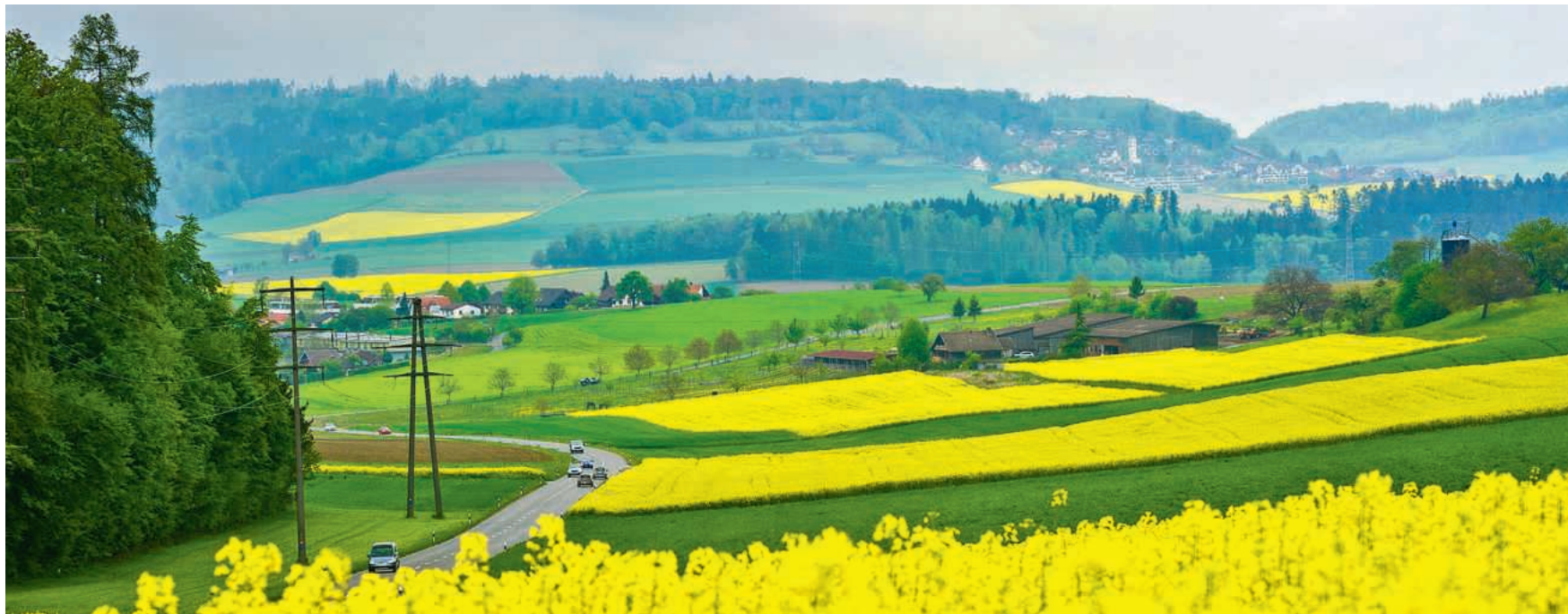
Gelb, wohin das Auge reicht – hier vom Eichmatthof auf dem Hertenstein in Richtung Freienwil und Schneisingen

Dazu «Biofuels Schweiz», der Verband der Schweizerischen Biotreibstoffindustrie: «In der Schweiz gilt