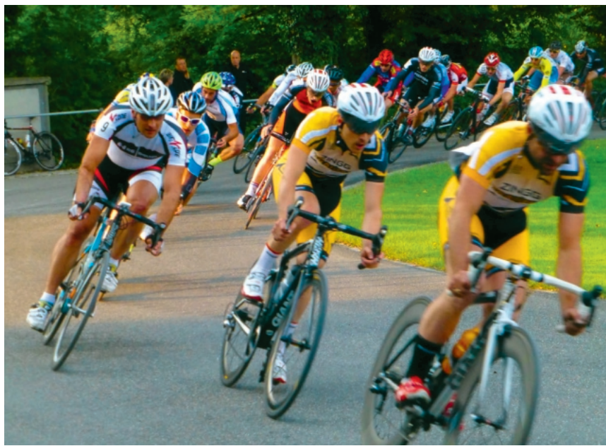
Bei den Brugger Abendrennen geht zünftig die Post ab