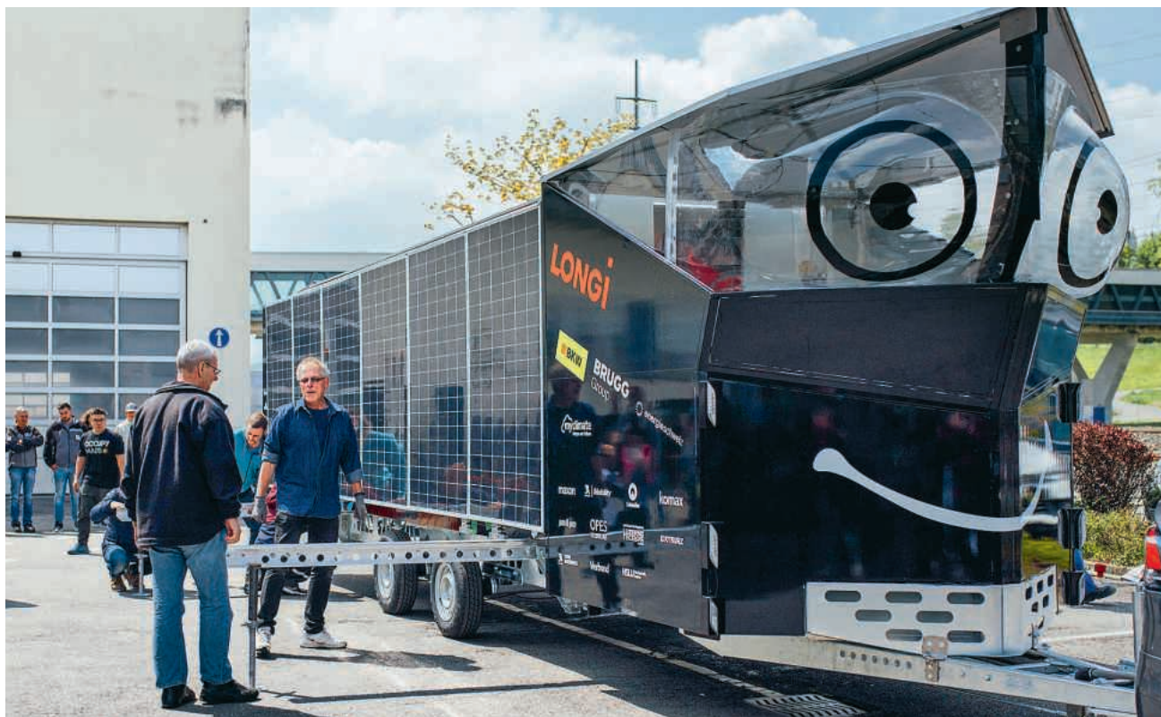
Tiny House auf Rädern: Der Solar Butterfly ist mehr als ein Wohnmobil. Er kann sich dank seiner grossen Solarflügel (80 m²) auf Knopfdruck in einen Schmetterling verwandeln

Das Projekt wird in mehreren Etappen durchgeführt und beginnt am 23. Mai mit einer rund 25 000 Kilometer langen Europa-Reise, quer durch